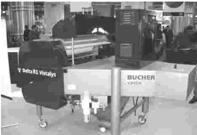
Abb. 3 Delta Vistalys R1