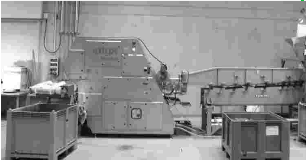
Abb. 5 Key Optyx G6