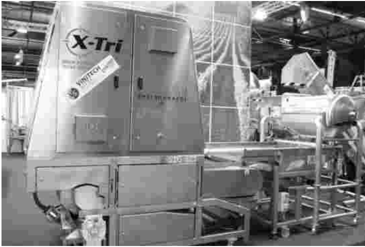
Abb. 4 Defranceschi X-Tri