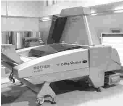
Abb. 2 Delta Vistalys R2